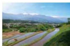
19 飯沼の棚田 上伊那郡中川村大草