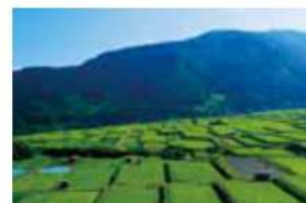
5 野沢沖の棚田 下高井郡野沢温泉村 大字豊郷