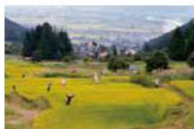
9 福島棚田 飯山市大字瑞穂