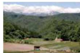
8 根越下沖の棚田 長野市大岡乙