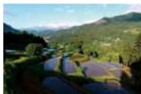
1 小谷村棚田群 北安曇郡小谷村