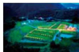
20 中尾の棚田 伊那市長谷中尾