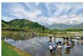
10 野平の棚田 北安曇郡白馬村 大字北城