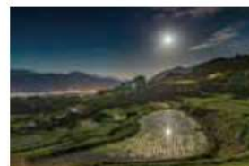
11 姨捨の棚田 千曲市八幡