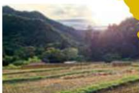
13 四賀大田棚田 松本市保福寺大田