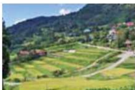
2 析倉の棚田 長野市中条御山里