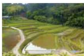
18 福島本村棚田 下伊那郡豊丘村神稲