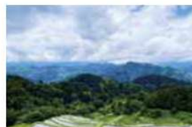
4 八重堀 長野市大岡甲