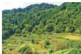
3 大西の棚田 長野市中条御山里