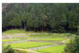
16 横旗棚田 下伊那郡根羽村横旗