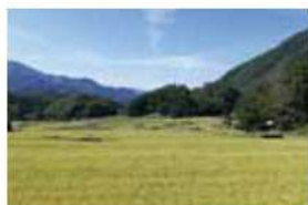
12 市野川棚田 東筑摩郡麻績村麻