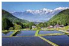
6 青鬼の棚田 北安曇郡白馬村大字 北城