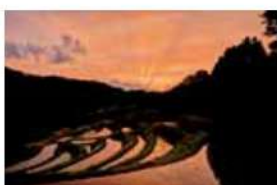
17 よこねたんぼ 飯田市千代