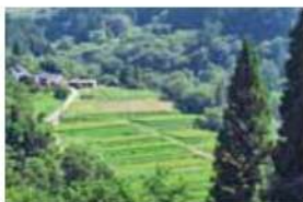
7 田沢沖の棚田 長野市中条御山里