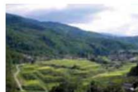
15 山室の棚田 伊那市高遠町山室